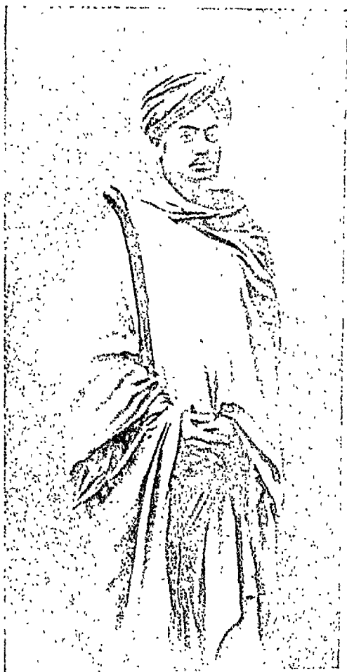
नरेन्द्रनाथ (स्वामी विवेकानन्द)